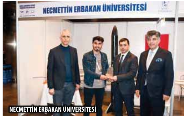
NECMETTİN ERBAKAN ÜNİVERSİTESİ