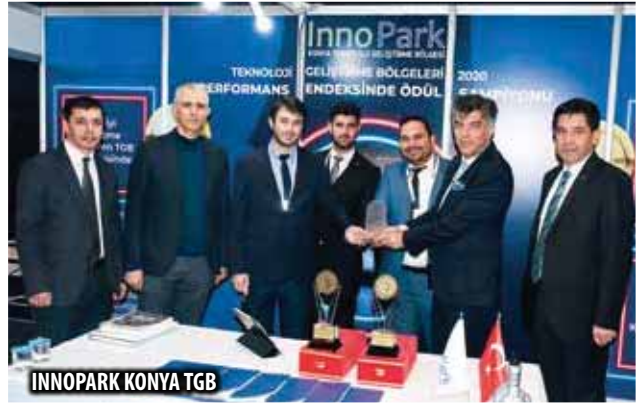
INNOPARK KONYA TGB