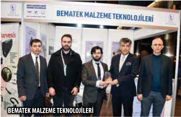
BEMATEK MALZEME TEKNOLOJİLERİ