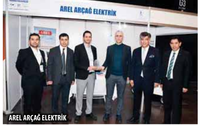
AREL ARÇAĞ ELEKTRİK