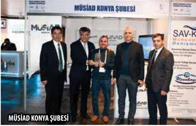
MÜSİAD KONYA ŞUBESİ