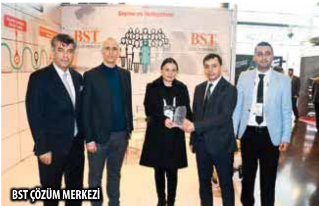
BST ÇÖZÜM MERKEZİ