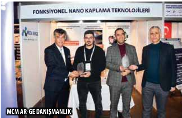
MCM AR-GE DANIŐMANLIK