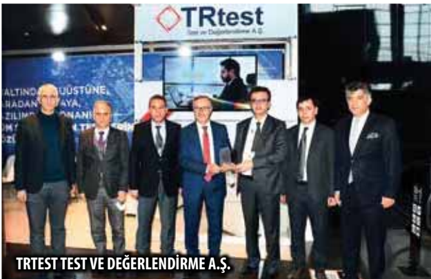
TRTEST TEST VE DEĞERLENDİRME A.Ş.