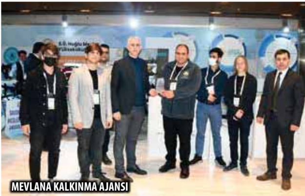
MEVLANA KALKINMA AJANSI