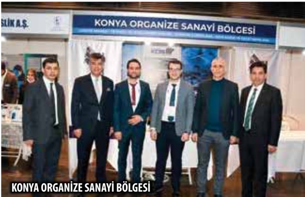
KONYA ORGANİZE SANAYİ BÖLGESİ