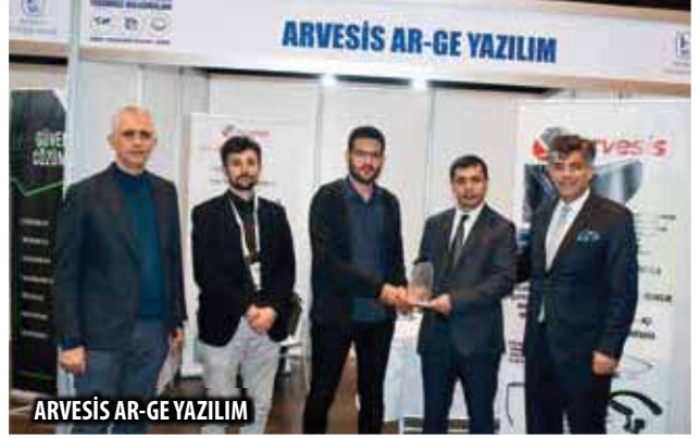
ARVESİS AR-GE YAZILIM