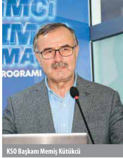
KSO Başkanı Memiş Kütükcü