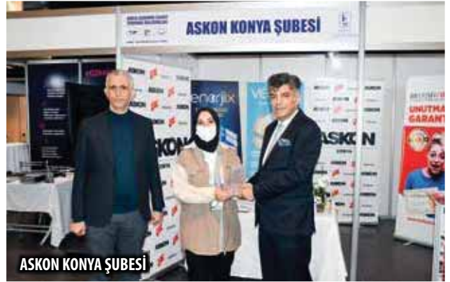
ASKON KONYA ŞUBESİ