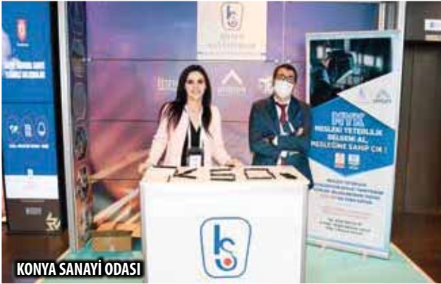
KONYA SANAYİ ODASI