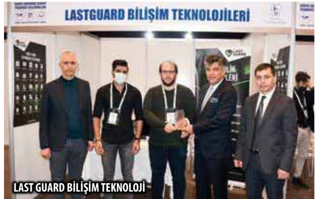
LAST GUARD BİLİŐİM TEKNOLOJİ