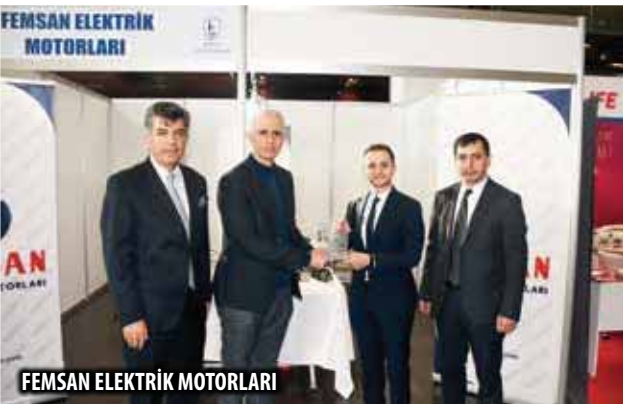
FEMSAN ELEKTRİK MOTORLARI