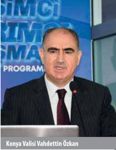
Konya Valisi Vahdettin Özkan