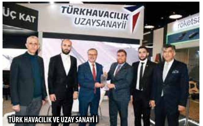
TÜRK HAVACILIK VE UZAY SANAYİ İ