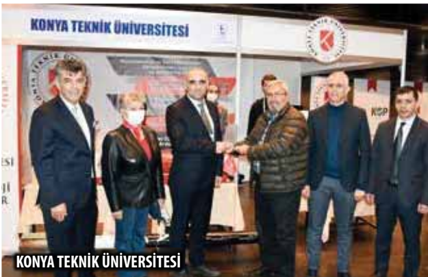
KONYA TEKNİK ÜNİVERSİTESİ