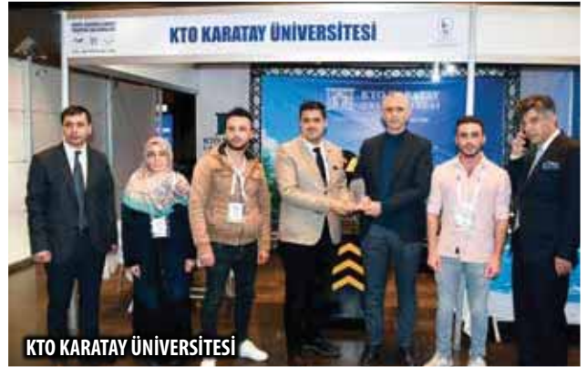
KTO KARATAY ÜNİVERSİTESİ